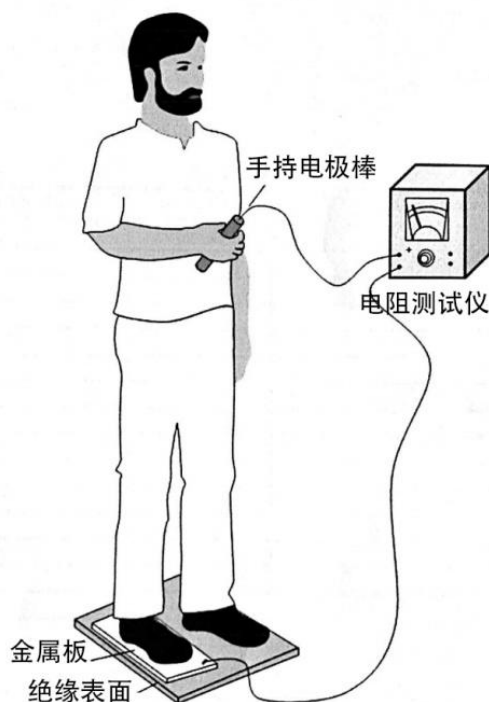
图 B.1 穿着时的电阻测试示意图

B.3.2 将B.1.2规定的导电金属板放置在B.1.1规定的绝缘表面上，检测人员手握B.1.3规定的手持电极棒，左脚站立于金属板上，如下图。